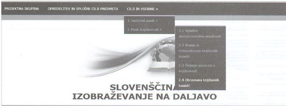
Slika 3: Dostop do gradiv